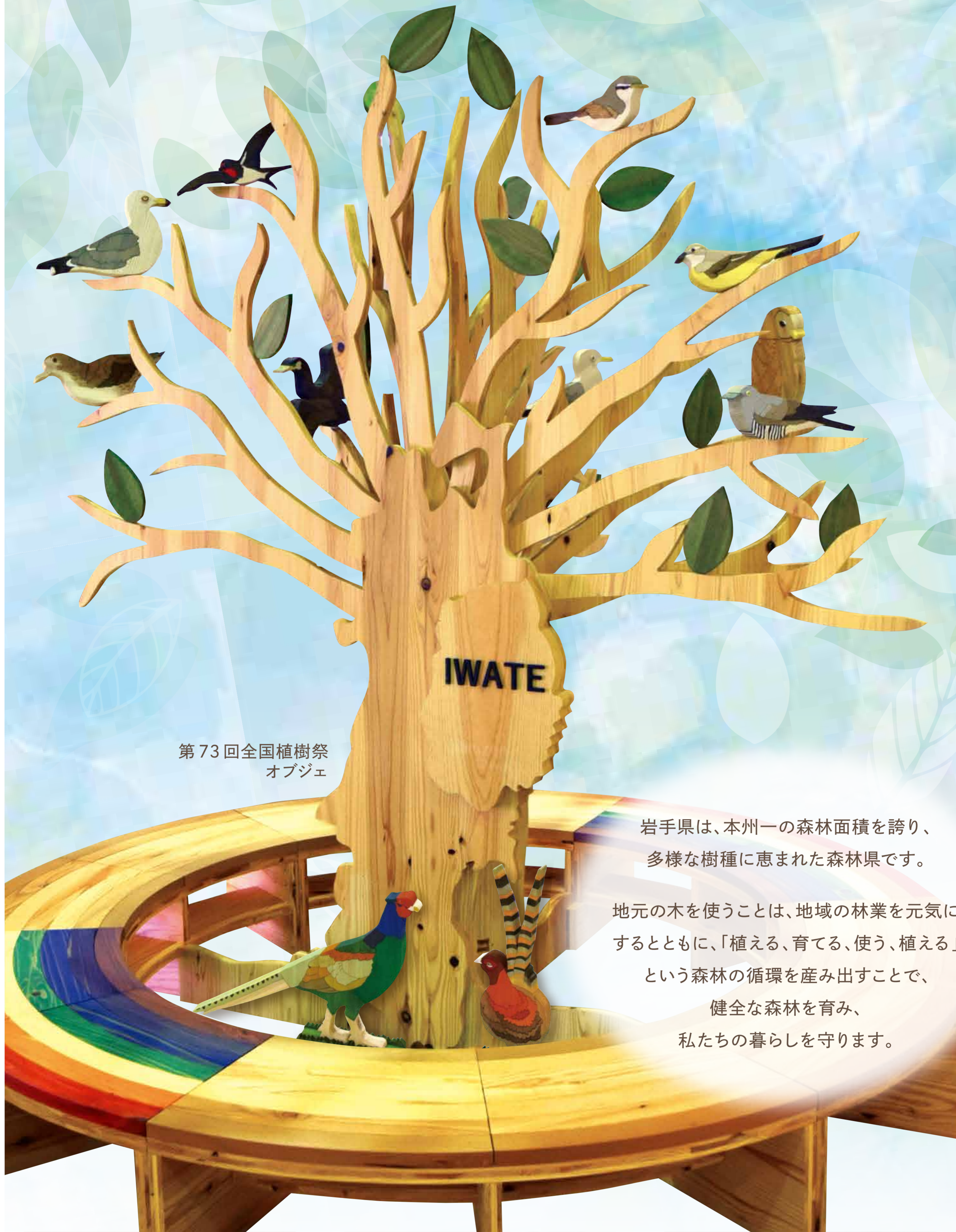
第73回全国植樹祭 オブジェ